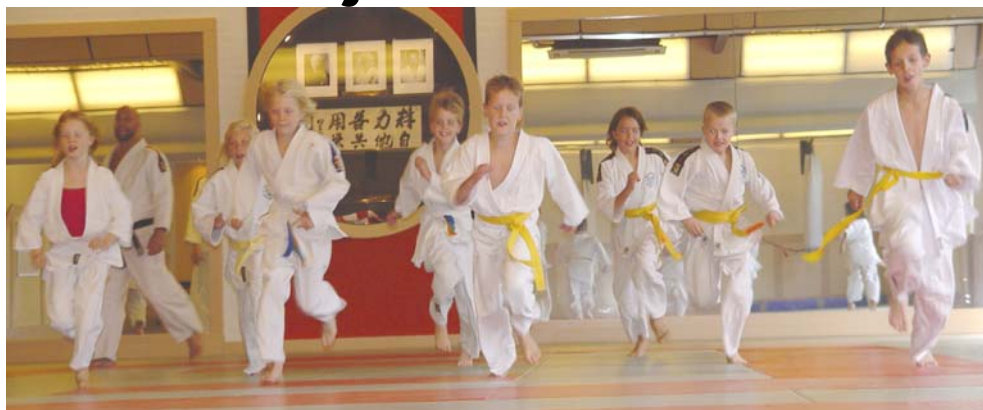
Even nog een kijkje in de 'oude' Tokio-zaal

We zijn weer terug in de voormalige Tokiozaal bij Achmea Amersfoort. Prachtige dojo. Er kunnen helaas geen ramen meer open maar er wordt gewerkt aan betere ventilatie.