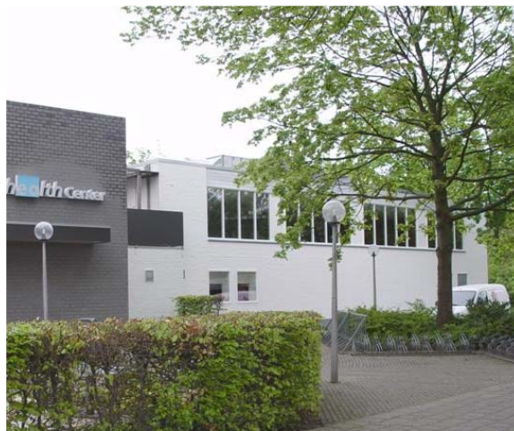
Terug in de voormalige Tokiozaal