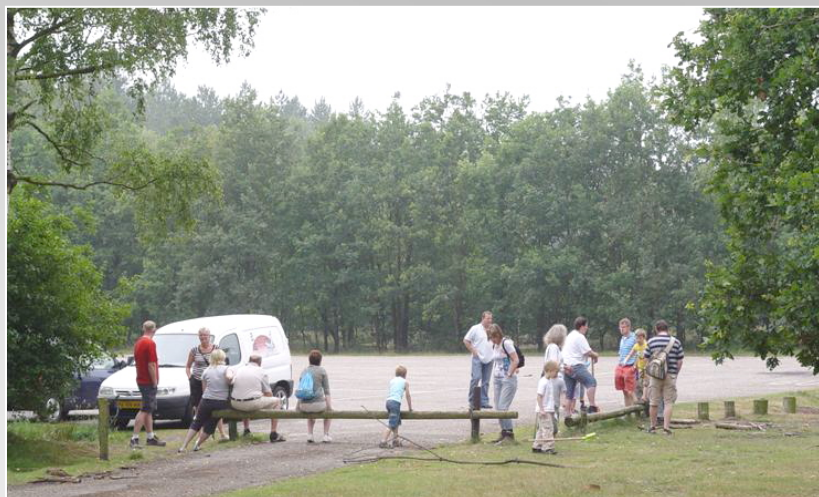
We verzamelen bij het Treekerpunt

We maken twee groepen. De ene groep gaat wandelend naar het Henschotermeer (ongeveer een half uur). De andere groep gaat er óók naartoe maar zij gaan in een rustig loopspasje (ongeveer 20 minuten).