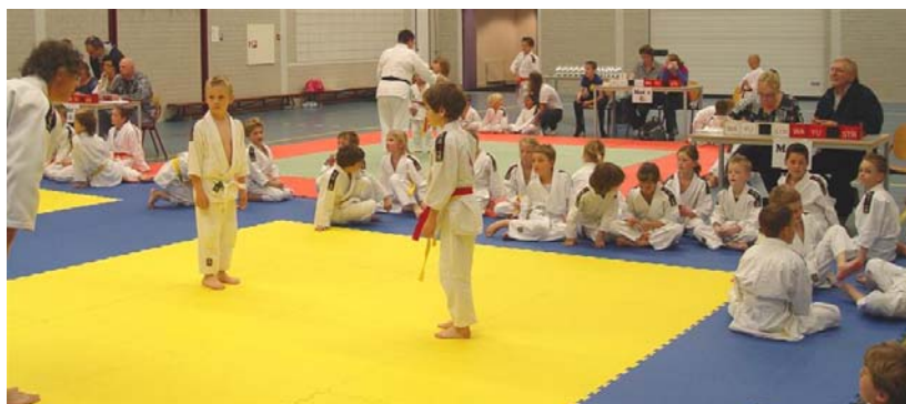
Alle judoka's maakten ongeveer 4 partijen