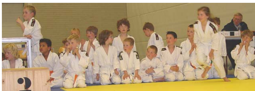
Sterre rent naar het erepodium.