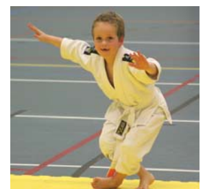
Het belangrijkste bij judo is je balans