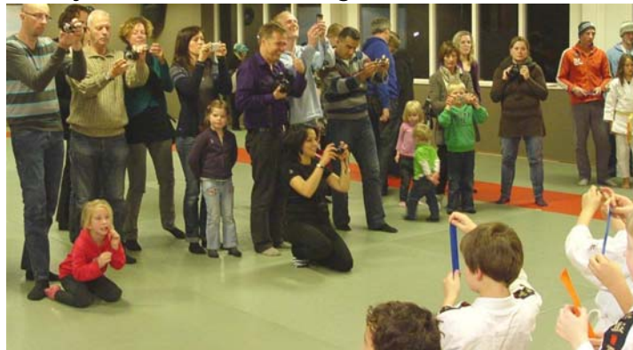
Na de examens waren er veel fotografen die alles wilden vastleggen voor het nageslacht