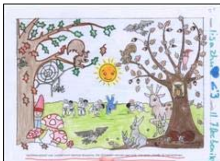
2 e prijs Lisa Zhu