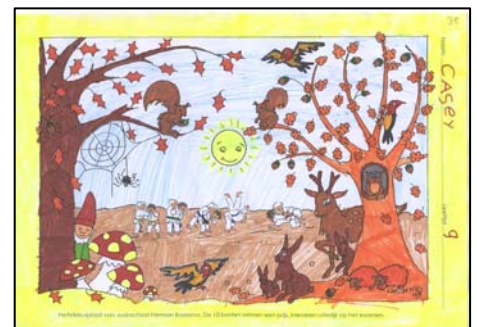
3 e prijs Casey van den Broek