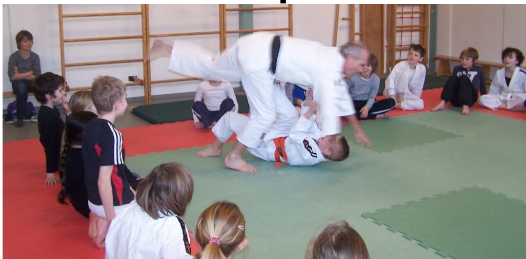
Hierboven laat hij zien dat een kleinere een grotere kan werpen