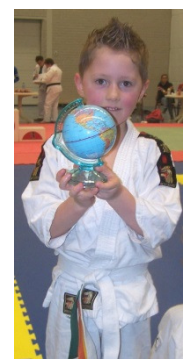
Goed-gedaan-prijs voor Nooa