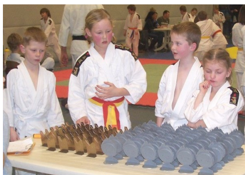
Eerst even kijken waar je het allemaal voor doet