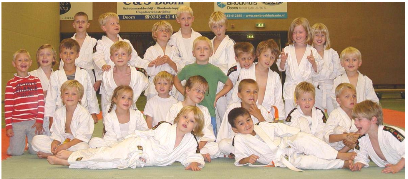
Hierboven de groep van de maand. Het is de eerste groep in Doorn.