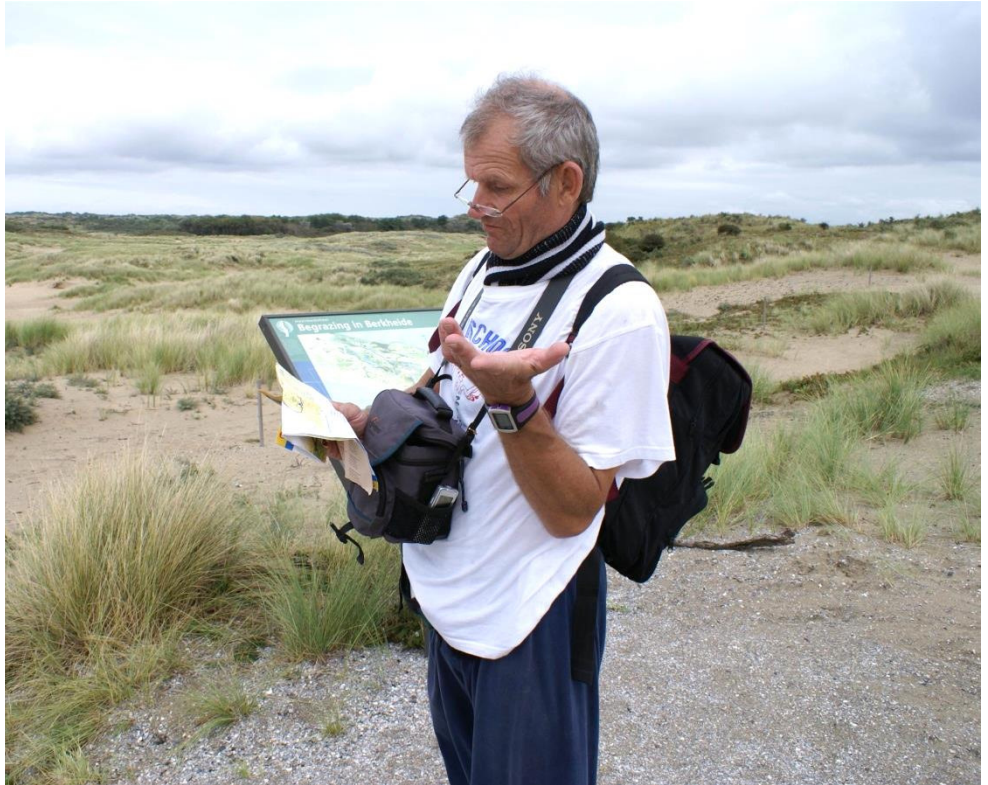
'Mijn hobby's zijn wandelen en verdwalen'

Tegenwoordig heb ik goede burens. Ook de plek is goed, net naast het centrum van Amersfoort.