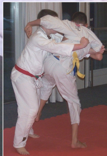
Leuke lessen met De Schakel en de buitenschoolse opvang