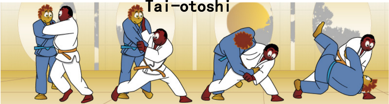
Ga naar Google en typ het woord Tai-otoshi. Je ziet dan nog veel meer over deze worp