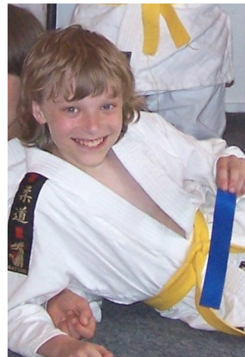
Een 10 voor Engels