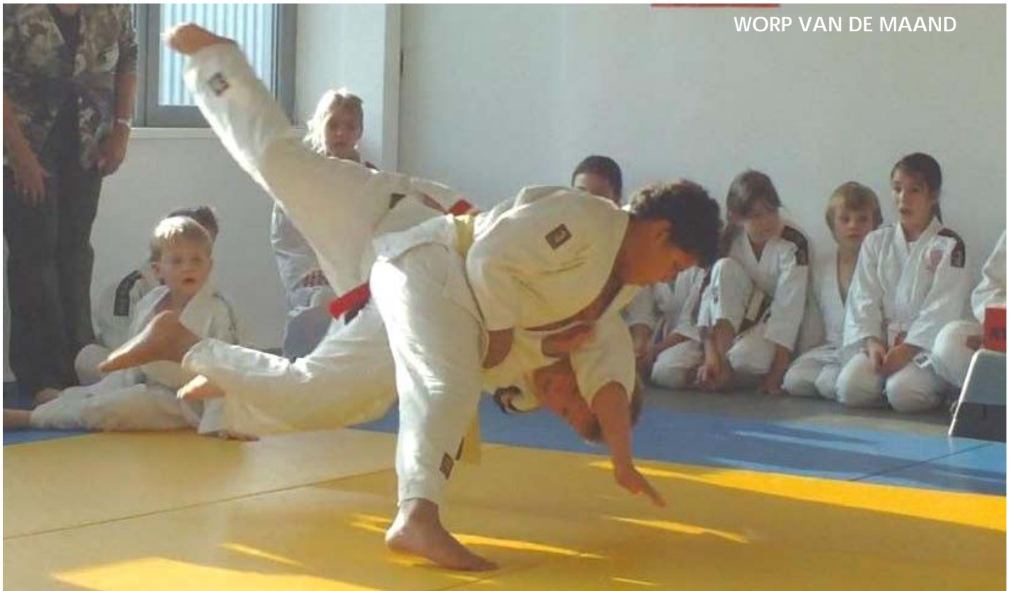
WORP VAN DE MAAND

hermanboersma@hotmail.com De Balans staat maandelijks onze website: www.judoschool-hermanboersma.nl telefoon: 033-4729247